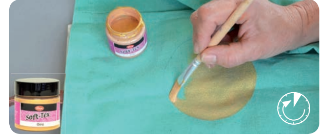
Technik, Technique, Technique, Tecnica