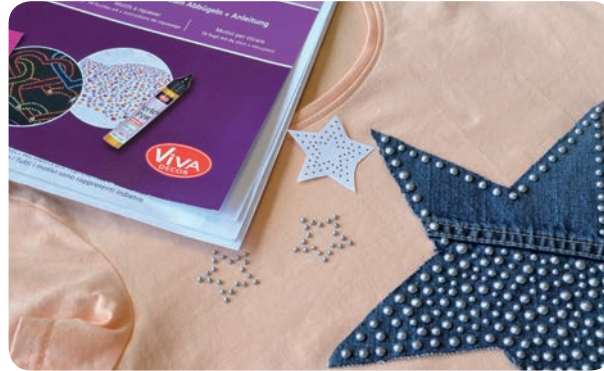
Material, Material, Matériel, Equipaggiamento