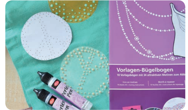
Material, Material, Matériel, Equipaggiamento