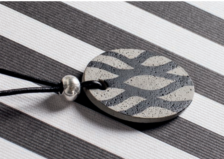
Art. 8301802 + 35007102 ↑